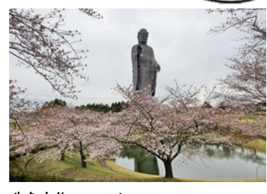
牛久大仏。ソメイヨシノ。

各地の桜はそろそろ見頃になってきました。この時期は「花霞」という言葉がよく使われます。遠方に群がって咲く桜が、一面に白く霞のかかったように見えるさま。そして「花吹雪」は花びらが吹雪のように舞い散ることをいいます。そして「花筏（はないかだ）」です。散った花びらが水面に浮かんで流れる様子を筏に見立てたもので、桜には風情のある言葉がたくさんあります。今回は牛久市内で見られる珍しい桜を集めました。