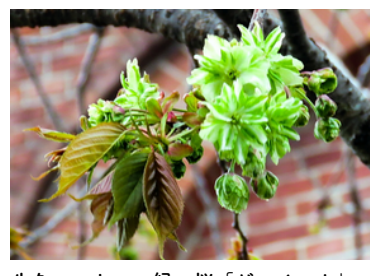
牛久シャトー。緑の桜「ギョイコウ」。