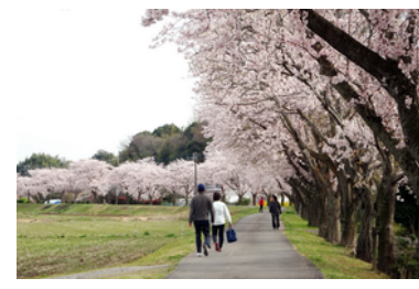
稲荷川外堤。ソメイヨシノ。