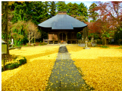
↑牛久市久野町「観音寺」。