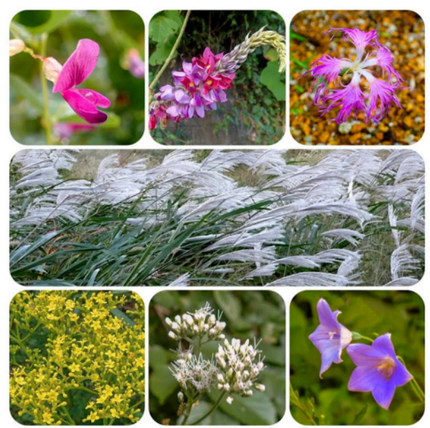
↑秋の七草。左上から、萩、葛花、撫子、尾花、女郎花、藤袴、朝貌。