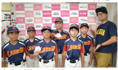
↑8月5日(月) #1738 | 奥野ライナーズの皆さん。

8月5日(月) #1738 今回のゲストは牛久っこのコーナー。緊張で声が少し小さいかな？と思うような皆さんでしたが、コーナーが進むにつれて、メンバー同士でツッコミあったりと本来の様子が見えまじりました。なんと、ひたちなか市民球場で行われた巨人対中日の始球式で投げたそうです。みんなが一番盛り上がったのはまさかの視聴者からの監督の印象は？でした。