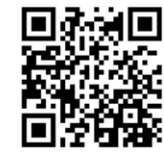
↑うしくかっぱ祭りの動画はこちら。

牛久市の毎年多くの人々が訪れる一大イベントといえ「うしくかっぱ祭り」です。さらに今年には「牛久シャトー夏祭り」と7月も8月も祭りづくしでした。 うしくかっぱ祭りは、昭和56年から始まった牛久市最大の祭りであり、今では市の夏の風物詩として定着しています。メイン会場となる花水木通りでは、伝統的な「かっぱばやし踊りパレード」が行われ、祭りのフィナーレには商工会青年部による商工みこしや上町山車の練り歩きが見られます。地域の人々が一体となって楽しむことができる貴重な機会です。今年にはちゃんみよが初の女性頭に挑戦！他にもサンバカーニバルと今年も見どころたくさんのかっぱ祭りでした。今年もちゃんみよTVで取材を行ってまいりますので、ぜひご覧ください。