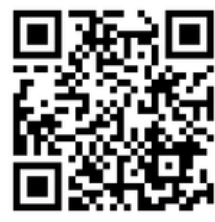
↑牛久シャトー夏祭りの動画はこちら。

牛久シャトー夏祭りは、2024年8月11日に開催されました。その名の通り、牛久シャトーで開催されたこのイベントは、牛久市近隣の飲食店やキッチンカーが出店し、訪れる人々は地元の美味しい食べ物や飲み物を楽しむことができました。牛久シャトーならではのワインも楽しむことができ、牛久市内では謎解きゲームが行われ、大人も子供も一緒に楽しむことができました。夜にはスカイランタンランタン点灯式と打ち上げが行われ、幻想的な夜空を楽しむことができます。打ち上げの様子は左下のQRコードからぜひご覧ください。