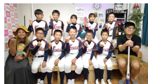
↑6月24日(月) #1709 | 刈谷イーグルスの皆さん。