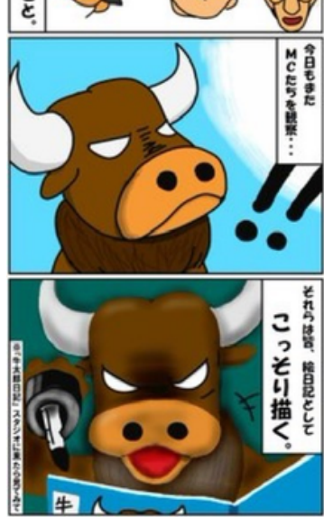
作: 牛太郎のマネージャー ※今月の藤代百先生の4コマ漫画はお休みです。