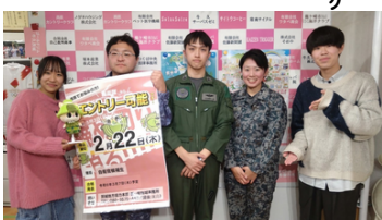
↑2月13日(火) #1622 | ゲストの自衛隊 茨城地方協力本部 龍ヶ崎地域事務所の皆さん。

前回は自衛官のお仕事についてお聞きしましたが、今回はさらに踏み込んで航空学生の方を实际にお招きしてお仕事の様子をお聞きました。